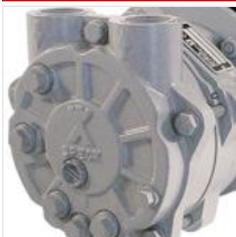
pompe per vuoto ad anello liquido